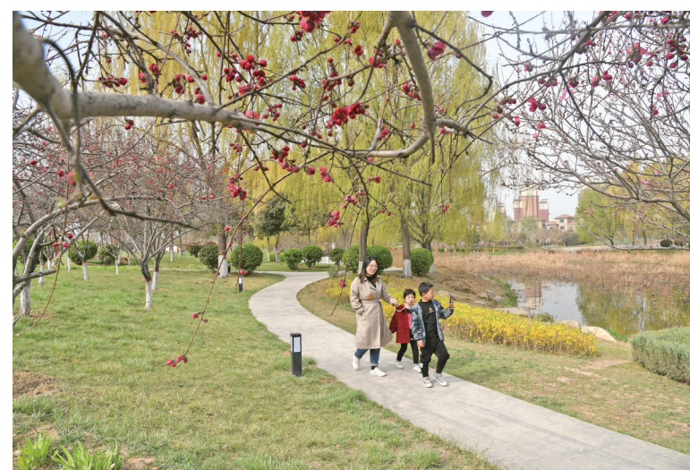
▲3月16日,游客在闻喜县冰水公园游玩。早春三月的闻喜县冰水公园万物复苏、春意盎然、景色宜人,五彩斑斓的花朵竞相绽放,散发出迷人的清香,吸引众多市民游客前来踏青赏景。

绿色制造步伐持续加速。今年2月,深圳雪花啤酒有限公司运城分公司、山西瑞格金属新材料有限公司经工业和信息化部官网公示拟认定为国家级绿色工厂。其中,深圳雪花啤酒运城分公司通过优化酿造工艺、推广中水回用与余热回收,实现单位产品能耗、水耗持续优于国家标准,固废资源化利用率达100%,为我市绿色制造体系再添新力。下一步,我市将持续深化绿色工厂梯度培育,推动更多企业走上绿色低碳发展之路,让绿色成为工业高质量发展的鲜明底色。