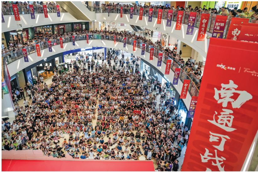
2025年6月29日,市民、球迷在江苏省南通市一处商场观看“苏超”第五轮南通队坐镇主场对阵宿迁队的比赛直播。

东北地区城市足球联赛(简称“东北超”)首批赞助商迎来烤猪蹄店个体户、江苏省城市足球联赛(简称“苏超”)为小微企业开设专属赞助通道……各地如火如荼的“城超”迎来阵阵“小微风”,让更多街边小店变身赛事“合伙人”,传递着足球之外的积极力量。