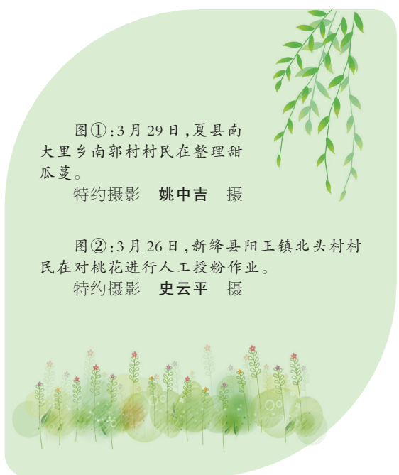
图①:3月29日,夏县南大里乡南郭村村民在整理甜瓜蔓。 特约摄影 姚中吉 摄

天津市现代农业发展中心相关负责人表示,此次活动普及了农机新技术,惠农新政策与安全生产知识,解决了农户在春耕备耕中遇到的技术瓶颈、政策疑惑等实际问题,调动了广大农户应用现代农业机械的积极性与主动性,打通了农机服务群众的“最后一公里”。