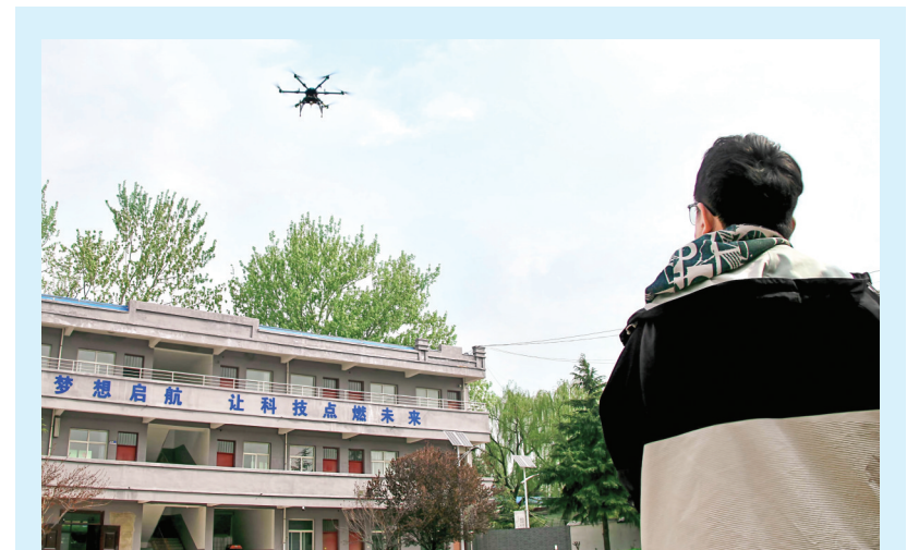
近日，学员在平陆县部官镇无人机培训基地练习无人机操控。该基地深耕低空实用技能人才培养，开设标准化多旋翼无人机驾驶全流程培训，让群众在家门口就能掌握专业技术。