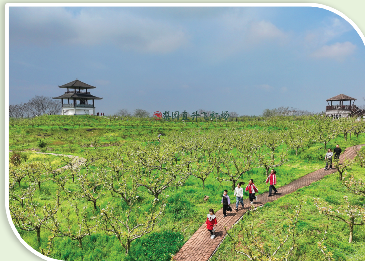
4月1日，小朋友在湖南省衡阳市珠晖区金甲梨园踏青游玩，乐享春假好时光(无人机照片)。