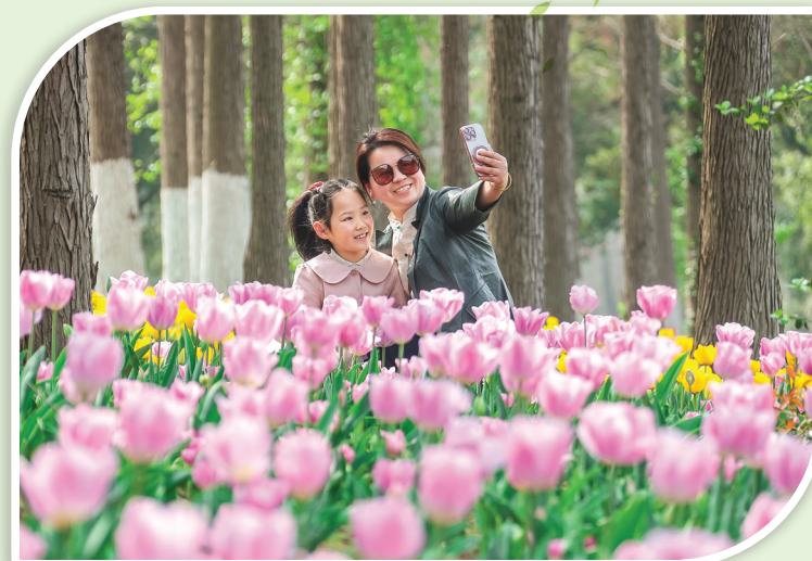
4月1日，小朋友和家长在位于江苏省句容市的江苏农博园享受春假。