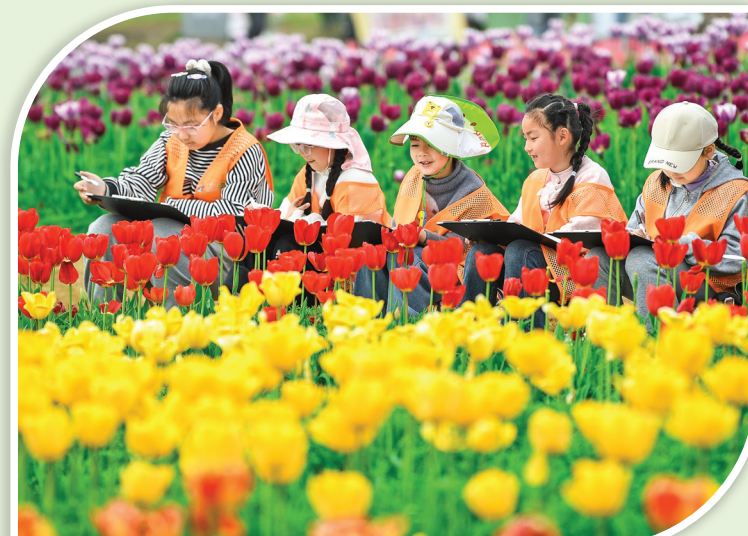
4月1日，在安徽巢湖经济开发区半汤郁金香高地，小朋友参加春假写生活动。