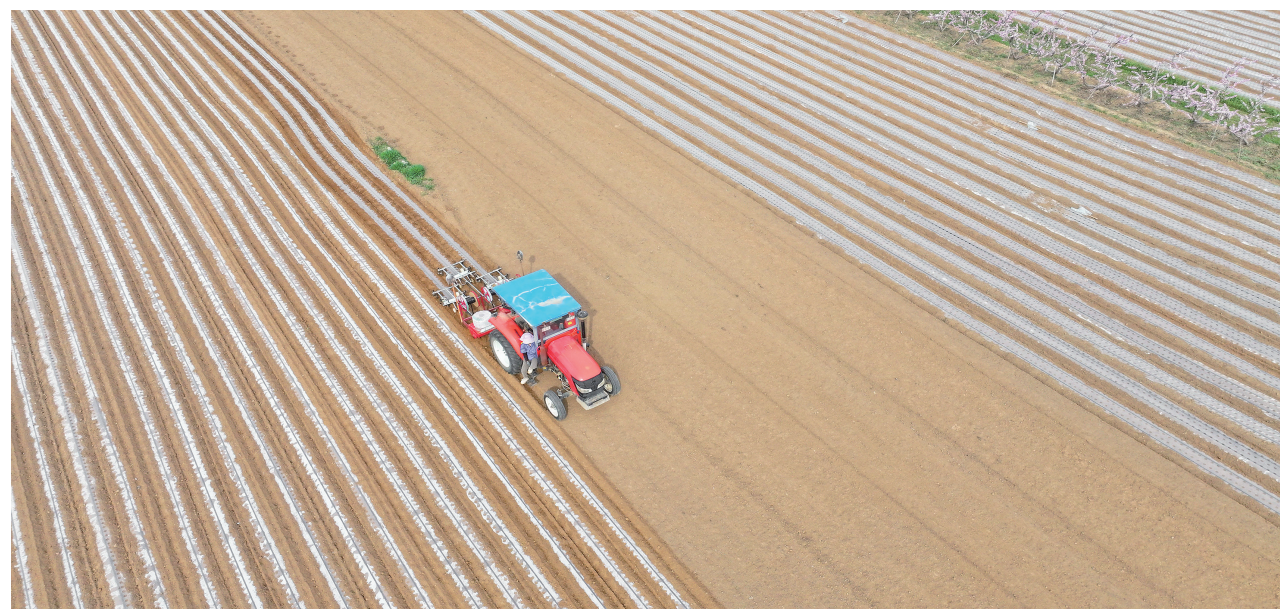
4月2日,稷山县魏峰镇村民在田间给中药材地黄铺设滴灌带和地膜。近年来,稷山县因地制宜大力发展

平陆县相关负责人表示,本次活动是国家级文旅活动赋能平陆发展的生动实践,也是当地打造文旅融合旅游热点门户的重要支撑,平陆县将以花为媒、以节为机,擦亮“桃花季”特色品牌,为创建全域旅游示范县、全面推进乡村振兴注入强劲动力,持续深化农文旅商融合,努力将平陆打造为美丽的田园、幸福的家园、休闲康养的世外桃源。