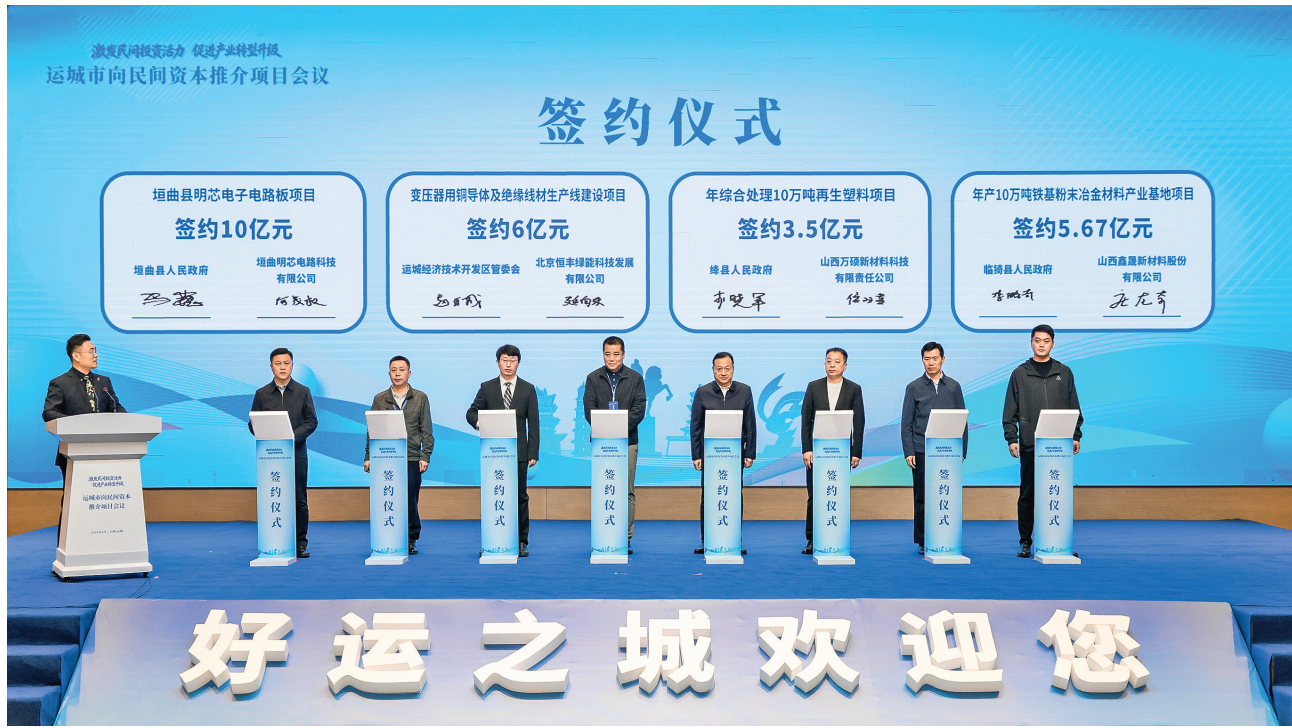
▲4月3日,运城市向民间资本推介项目会议召开。图为项目签约仪式现场。