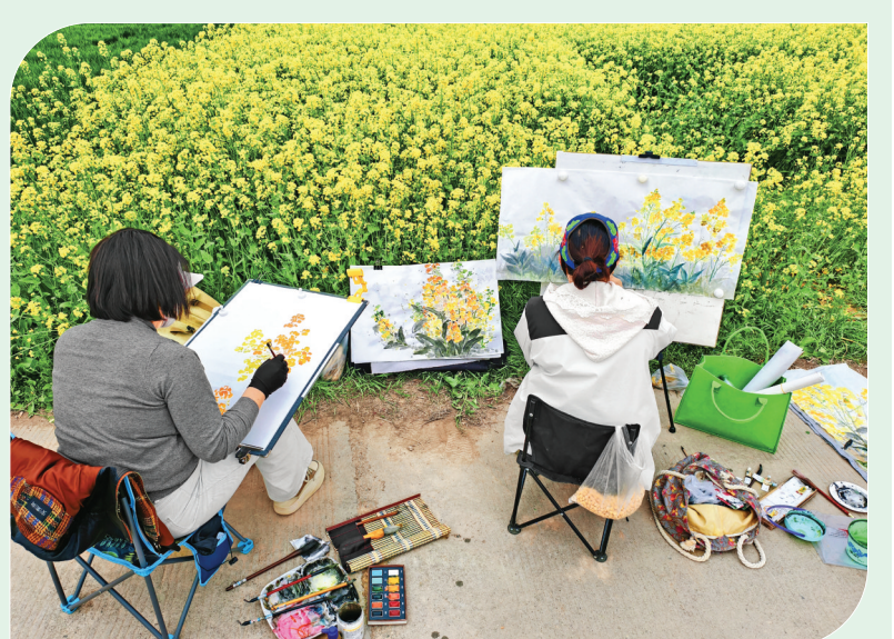
4月4日，美术爱好者在平陆县邵官镇黄灿灿的油菜花田边写生，笔墨间尽显自然之美，为赏花期增添文艺气息。