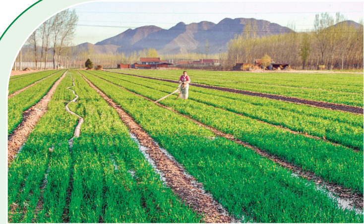
上图:4月7日,河北省遵化市东新庄镇农民在麦田浇水。

传习所,1921年合并组建为交通大学。近日,四所交通大学全体师生给习近平总书记写信,汇报学校130年发展历程和办学成绩,表达为强国建设、民族复兴伟业贡献力量的决心。