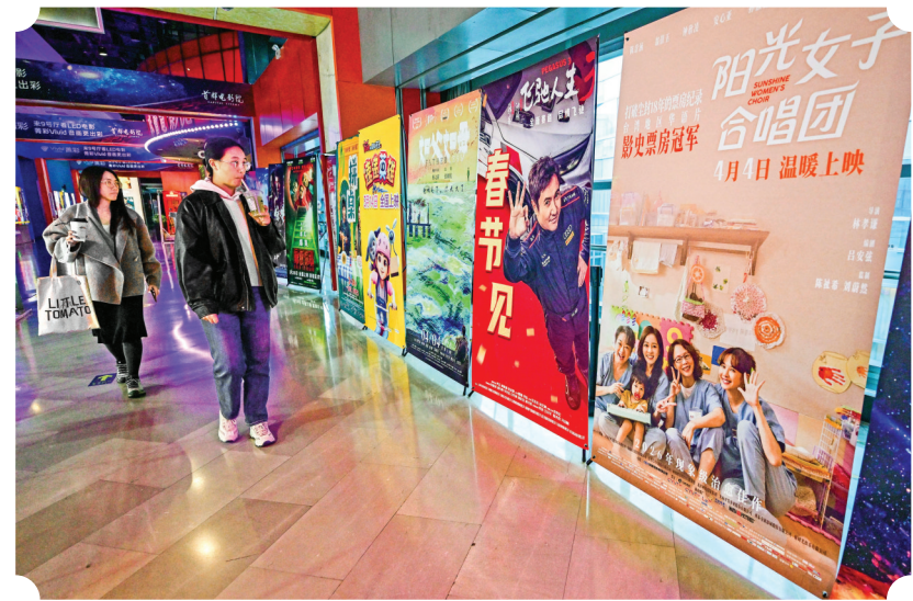
近日,在首都电影院西单店,观众从台湾电影《阳光女子合唱团》的海报旁走过。