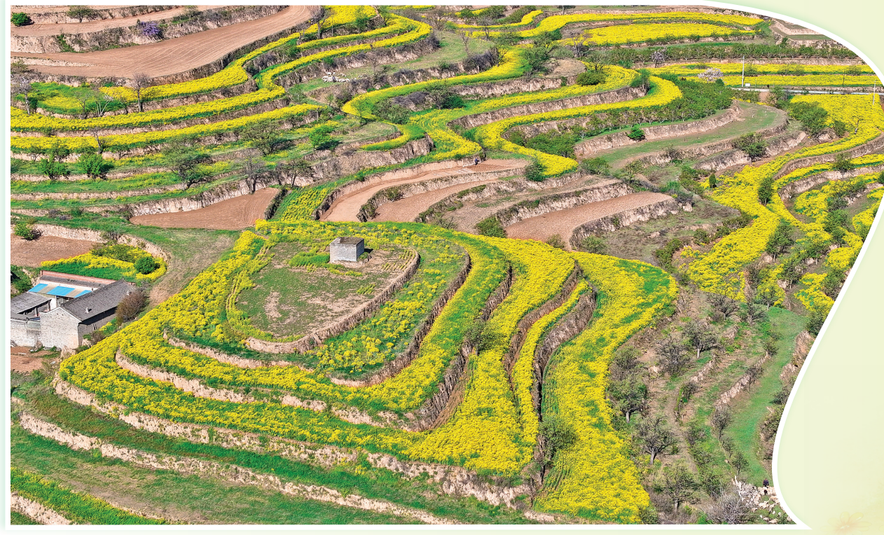
连日来,稷山县太阳乡小阳村梯田上,板蓝根花竞相绽放。从空中俯瞰,犹如铺开的一幅生机勃勃的乡村振兴画卷(4月10日报)。 近年来,稷山县因地制宜调整农业产业结构,采用“党支部+合作社+产业”发展模式,大力发展中药材产业,种植柴胡、黄芩、板蓝根等中药材10万亩,建设道地中药材种植标准化示范基地,打造农文旅融合示范点,以中药材特色产业助力乡村全面振兴,带动农民增收致富。

产业发展也有了“主心骨”。特色产业党小组通过实地调研,发展200亩玫瑰花,与原有的300亩北京菊连片打造,让“赏花经济”成为激活北大里村发展的新动能。 南大里乡党委书记张志荣豪情满怀地说:“我们将坚决按照县委指示精神,不断深化拓展‘把党小组建在村事上’这一新时代党建载体,让广大党员的先锋模范作用得到充分发挥,全力助推‘新夏都·群治理’走深走实、见行见效。”