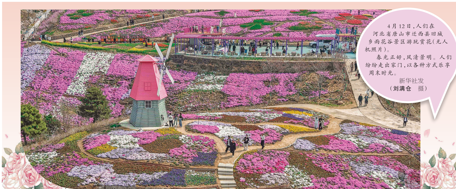
4月12日，人们在河北省唐山市迁西县旧城乡雨花谷景区游玩赏花(无人机照片)。 春光正好，风景清明。人们纷纷走出家门，以各种方式乐享周末时光。