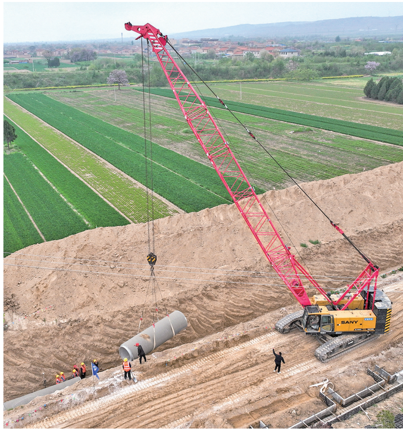
4月13日，在稷山县清河镇清河村，万家寨水控集团的农田灌溉管道施工有序推进。

该工程完工后，将有效改善当地农田灌溉条件，提升水资源利用效率，为粮食稳产增收、农业产业发展提供坚实水利支撑。