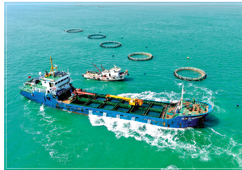
近日,作业船只准备停靠山东青岛西海岸新区鲁海丰海洋牧场,将2026年首批10万尾鱼苗投入深水网箱进行养殖。据悉,青岛鲁海丰海洋牧场地处国家一类水质海域,水温适宜、盐度均衡,比较适宜海鱼生长。