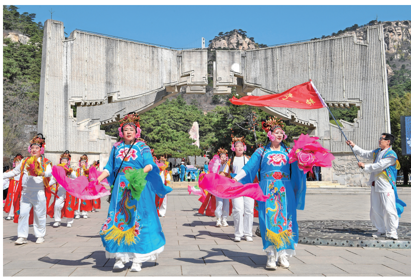
4月23日,在辽宁省北镇市医巫闾山景区,秧歌队在第36届北镇梨花节上表演秧歌舞。