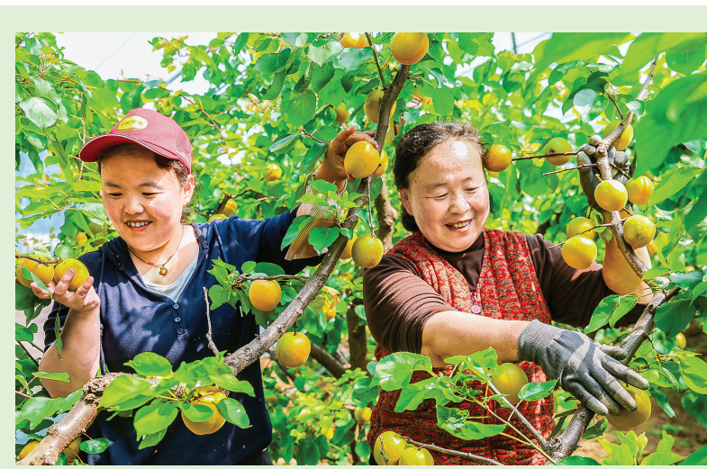
近日,夏县瑶峰镇下渝底村的大棚内,金黄圆润的杏挂满枝头,果农忙着采摘,现场一派丰收繁忙的景象。

“莫道桑榆晚,为霞尚满天”。在人口老龄化的时代背景下,医养结合模式为老年人幸福晚年筑牢了健康屏障,也为养老服务业高质量发展指明了方向。众康养护中心负责人表示,下一步,将不断优化服务流程、完善服务体系、提升服务品质,进一步丰富医养康养服务内容,聚焦老年人急难愁盼问题,用更专业的医疗保障、更贴心的生活照料、更浓厚的人文关怀,用心守护每一位老年人的幸福“夕阳红”,全力打造让老年人舒心、家属放心的高品质养老服务标杆,为推动全市养老服务业高质量发展贡献更多力量。