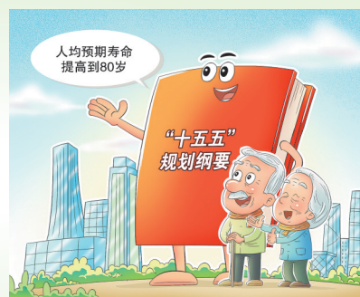
▲健康新期待 王琪(山东) 作