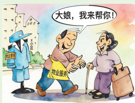
▲转变 韦荣景(广西) 作