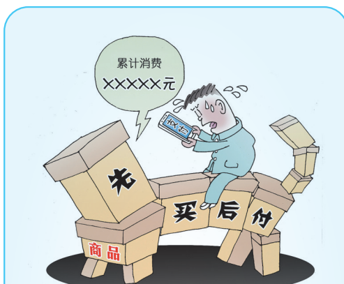
▲“骑虎难下” 蒋跃新(新疆) 作