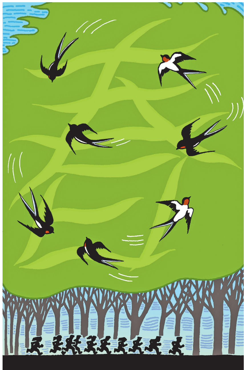
▲燕舞裁春 王真(黑龙江) 作