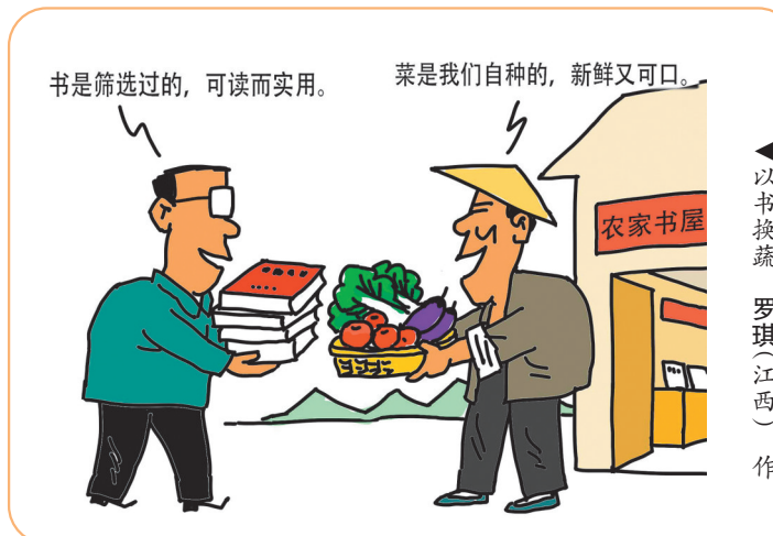
▲以书换蔬 罗琪(江西) 作