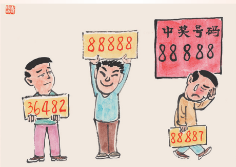
▲人之所以感到失落，不是因为相差远而是因为相差近。 刘志永(天津) 作