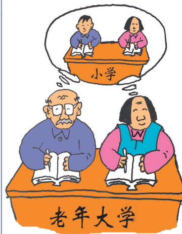
▲又是同桌 陈英远(安徽) 作

“又是同桌”展现老有所学的积极风貌，“以书换蔬”聚焦书香润乡的文明理念，“码”有陷阱”敲响反诈防骗的警钟……源于生活、高于生活的漫画作品，以独特的艺术语言，助推社会向善向美。