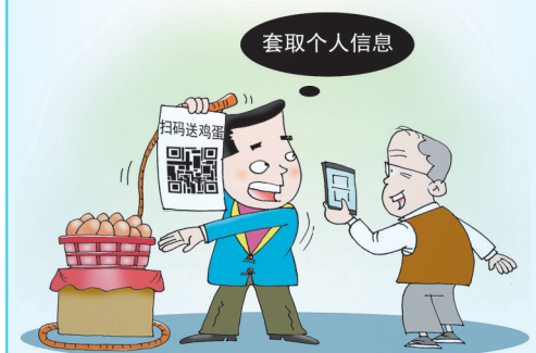
▲“码”有陷阱 沈海涛(江苏) 作