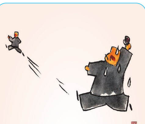
▲把泥巴抛向别人，先脏自己的手。 田志仁(黑龙江) 作