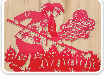
▲临猗县农村文化墙“二十四节气与农耕文明”中的“春分”节气