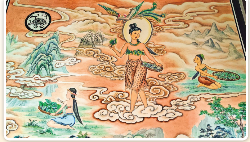
▲夏县西阴村寺庙中的「嫫祖」壁画

如前所述，1926年考古学家李济在西阴村发掘时，发现“半个人工切割下来的蚕茧标本”，1928年李济曾将其带到美国进行检测鉴定，证明其为“家蚕的老祖先”，他由此联想到嫫祖养蚕的传说，并认为“蚕丝文化是中国发明