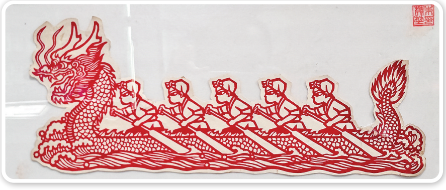
▲运城博物馆展出的“赛龙舟”剪纸作品