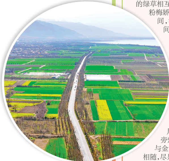
▲盐湖区义同村的油菜花田

据了解，景区以自然山野、古建风光为特色，主打放松治愈、轻度假体验，让游客尽享诗与远方的惬意时光。