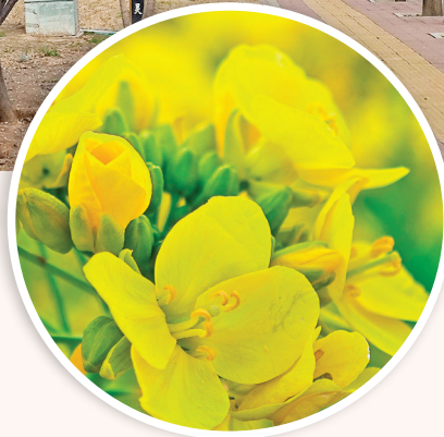
▲金蕊凝香

场景介绍：县道北侧大片油菜花肆意绽放，金黄一片，耀眼夺目。沿县道西行，路旁紫叶李花悄然盛开，淡雅清新，与金黄油菜花相映成趣，一路繁花相随，尽显春日田园的灵动。