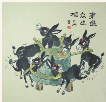
▲磨盘众生相 李景山(黑龙江) 作