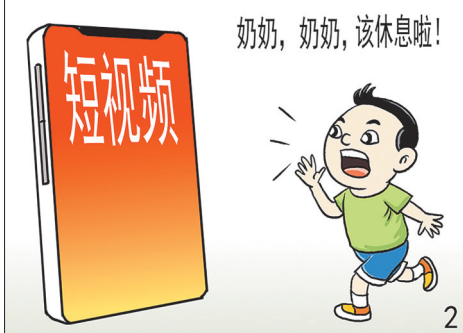
▲此一时,彼一时。 刘志永(天津) 作