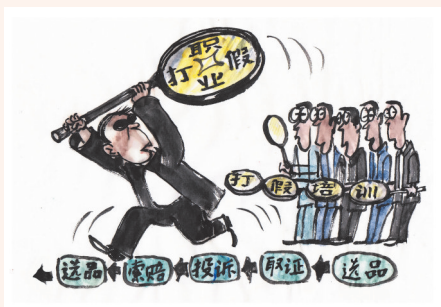
▲“打假”培训 王成喜(山东) 作