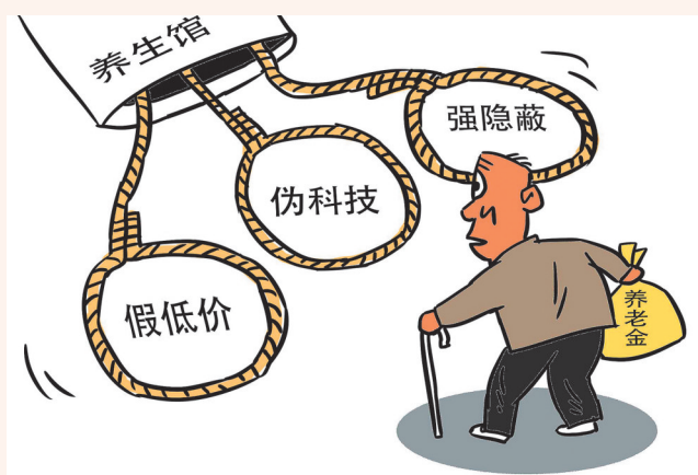
▲套路老人 罗琪(江西) 作