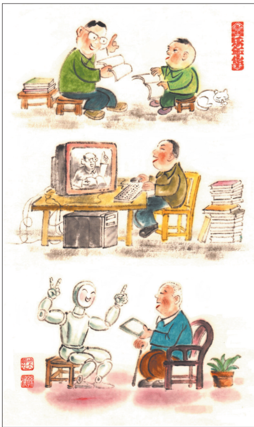
▲活到老,学到老。 孙晨(北京) 作