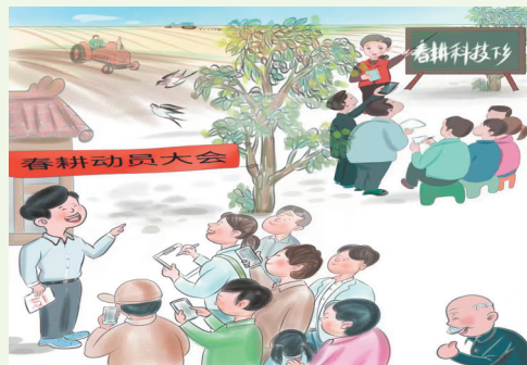
▲春风来了 刘少良(吉林) 作