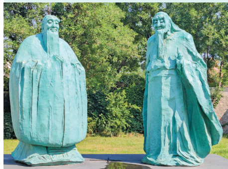
▲夏县宇达青铜文化产业园孔子与老子“问道”雕塑

“智”字在甲骨文里，左边是“知”，右边是“于”，本意是“认识宇宙规律”。古人认为，真正的智慧不是耍小聪明，而是对事物本质的通透把握。“愚”则很有意思，金文里写作“禺”加“心”，“禺”像一只大头猴子，古人用“心似猕猴”形容鲁莽无知，后来慢慢演变为“愚笨”的意思。但细究古籍会发现，“愚”在早期并非纯粹的贬义词，《论语》里“宁武子邦有道则知，邦无道则愚”，这里的“愚”更像是一种主动选择的收敛。