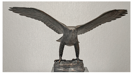
▲《鹰击长空》雕塑

《史记·殷本纪》记载，商朝的开国君主商汤外出，见到捕猎者在野外张网，将四面都围困起来。商汤认为这样做会让鸟兽都被捕尽，于是让其去掉三面网，只留一面。诸侯听闻这件事，赞誉商汤能够为鸟兽广开生路，认为其德行高尚。此时正值商灭夏的前夕，商汤保护鸟兽之举，赢得诸侯人心，为其击败夏桀奠定重要的舆论基础。由此可见，善待鸟兽体现的重要伦理精神，为人为之共识。此后，制约包括君主在内的各种人的行为以爱护鸟兽，逐渐形成制度规定。