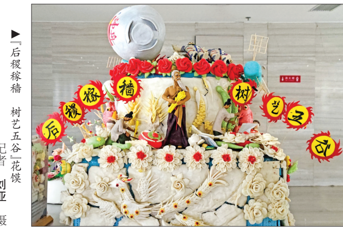
后稷稼穡 树艺五谷 花馍

他成年后便能因地制宜，适时播种，善于种植各种谷物，并教导百姓耕种之术。他的才能为帝尧所知后，被举为农师，让他管理与指导天下农事，又因“稷”为百谷之长，被称“稷”。由于他发展农业有功，帝尧封他于郟地，号曰“后稷”。