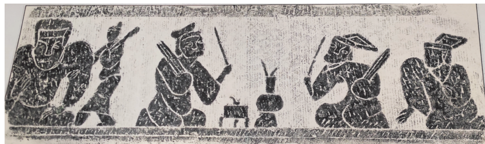
▲运城博物馆“大汉光影”南阳汉画像石拓片精品展“投壶”拓片

宋代投壶主要在文人中流行，文人们“投壶弈棋，烧烛夜归”。北宋名臣司马光撰写了《投壶新格》，他结合投壶技艺宣扬儒家的中庸之道，强调投壶有助于提升个人修养。他还对投壶的用具和规则做了详细规定，使之更加规范。比如，在投壶方式上，司马光定了“有初”（第一箭入壶者）、“连中”（第二箭连中）、“贯耳”（投入壶耳者）、“散箭”（第一箭不入壶，第二箭起投入者）、“全壶”（箭箭都中者）、“有终”（末箭入壶者）、“骝箭”（投入壶中之箭飞跃出来，接着又投入中者）等二十种名目。（《同舟共进》）