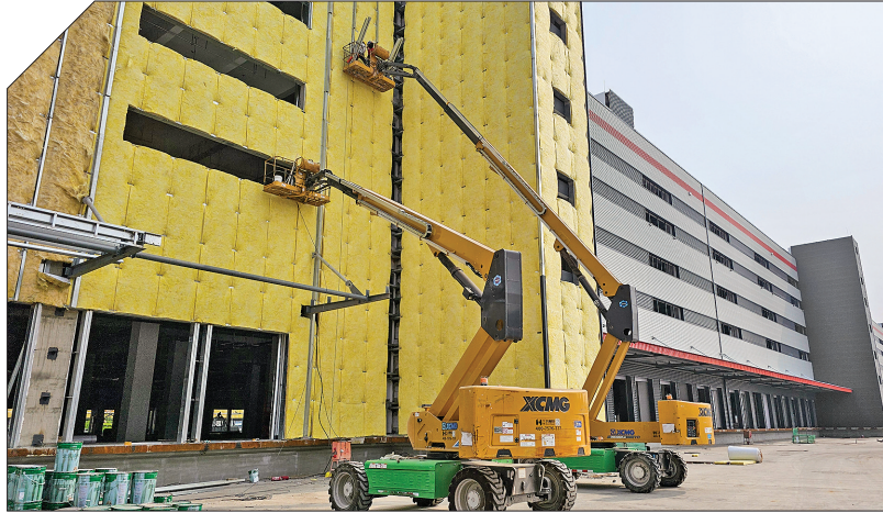
组图为项目建设现场

一边是闲置资源亟待唤醒、低效资产亟须盘活,一边是新兴产业项目亟待落地、市场需求迫切,供需双向契合之下,新绛县“腾笼换鸟”产业升级行动顺利破题。