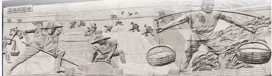
▲中心城区“垦畦浇晒法”主题砖雕画中,劳动人民在盐池辛勤劳作场景

古代劳动人民的辛勤劳动创造了生活本身和精神意境。魏晋诗人陶渊明所作《归园田居·其三》中写道:“种豆南山下,草盛豆苗稀。……衣沾不足惜,但使愿无违。”这首诗展现出我国古代人民早起劳作,傍晚收工,期待有好收成的场景,展现出劳动人民辛勤劳动的形象。唐代诗人李绅写道:“锄禾日当午,汗滴禾下土。谁知盘中餐,粒粒皆辛苦?”《悯农》融洽地将珍惜食物与辛勤劳动结合起来,一直影响塑造着中国人的勤俭节约的美德。唐代诗人王维写道:“屋上春鸠鸣,村边杏花白。持斧伐远扬,荷锄觞泉脉。”这首《春中田园作》的前四句展现出了古代人们愉快劳动的情境和勇于探索的精神。可见,劳动不仅可以磨炼人的意志,劳动的协作性还可以培养人的互助和团结精神。自强不息是古代劳动人民战胜困难的智慧之源。古代物质资源匮乏、自然条件恶劣,勤劳的中华儿女自强不息,积极探索。到了宋明时期,科技、手工业都变得发达。宋朝时发明了天文仪等多种精密仪器,明朝时期郑和七次下西洋代表了那个时代科技、造船业的世界先进水平。古代劳动人民智慧的结晶反应在各个领域:栩栩如生的兵马俑、巍峨长城、巧夺天工的都江堰、贯通南北的大运河;素纱禅衣、榫卯结构、记里鼓车,等等,无一不是凝聚劳动者勤劳智慧的伟大成果,尽责、乐业、精益求精的工匠精神使这些遗宝成为历史的烙印和华夏子孙精神的内核。(《光明日报》)