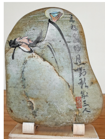
石画工艺品 ▲运城工艺美术展馆展出的《李白》黄河石本栏图片 记者 刘亚 摄影