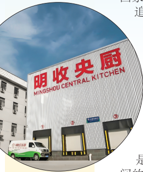
▲明收央厨 ▲生产扣碗

经验,让他对“好吃”这件事有一种近乎固执的标准:味道要对、安全要硬,做法要经得起追问。