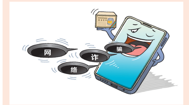
花言巧语 王真(黑龙江) 作