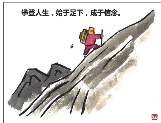
攀登人生,始于足下,成于信念。 田志仁(黑龙江) 作

编者按 人间烟火四季,最暖不过母亲怀抱。风启立夏,万物向阳。愿每一位平凡又伟大的母亲,都被温柔以待,福寿绵长。 母亲,这个概念又是宽泛的。小到一个家的母亲,大到祖国母亲,再延伸到我们赖以生存的地球,亦可称之为母亲。 “一张蓝图绘到底”“一任接着任一任干”就是对地球母亲最好的回报。从黄沙漫漫到林海葱茏,我们的付出能让地球母亲变得更好,地球母亲也会更爱我们。 方寸漫画,万象人间。在埋头劳作、耕耘美好的同时,也谨记“别上骗子的当”,要小心网络的“花言巧语”,更要警惕天上不会掉馅饼…… 这个五月,让我们心怀感恩、砥砺奋进,点亮属于自己、也能温暖他人的那束光。