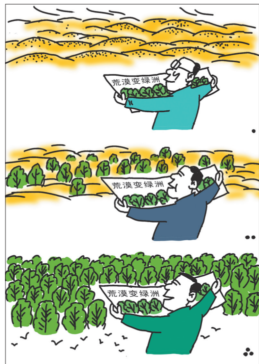
一张蓝图绘到底 罗琪(江西) 作