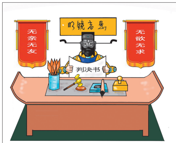
机器人当法官——铁面无私 张昕(山东) 作

编者按 人间烟火四季,最暖不过母亲怀抱。风启立夏,万物向阳。愿每一位平凡又伟大的母亲,都被温柔以待,福寿绵长。 母亲,这个概念又是宽泛的。小到一个家的母亲,大到祖国母亲,再延伸到我们赖以生存的地球,亦可称之为母亲。 “一张蓝图绘到底”“一任接着任一任干”就是对地球母亲最好的回报。从黄沙漫漫到林海葱茏,我们的付出能让地球母亲变得更好,地球母亲也会更爱我们。 方寸漫画,万象人间。在埋头劳作、耕耘美好的同时,也谨记“别上骗子的当”,要小心网络的“花言巧语”,更要警惕天上不会掉馅饼…… 这个五月,让我们心怀感恩、砥砺奋进,点亮属于自己、也能温暖他人的那束光。