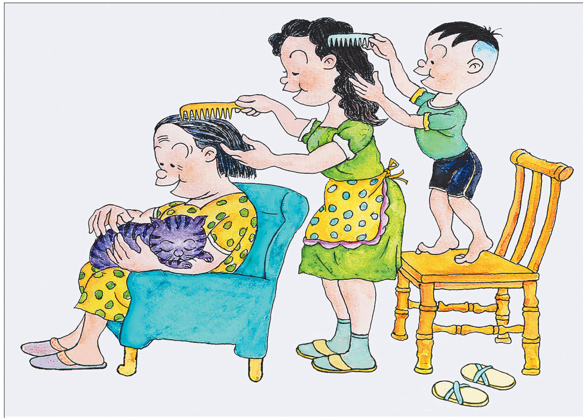
给妈妈梳头 于海林(辽宁) 作