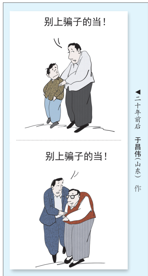
二十年前后 于昌伟(山东) 作