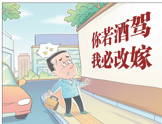
“雷人彪语” 王琪(山东) 作